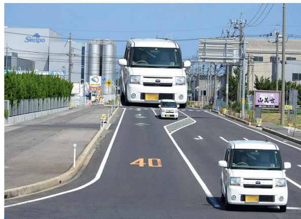
Bild 3: Das perspektivisch richtig verkleinerte vordere Auto für die hintere Position.