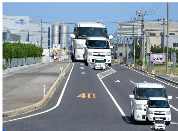
Bild 5: Die Dreiergruppe vorne ist identisch mit der Dreiergruppe hinten. Originalbilder: Akiyoshi Kitaoka, Modifikationen: Bernd Lingelbach