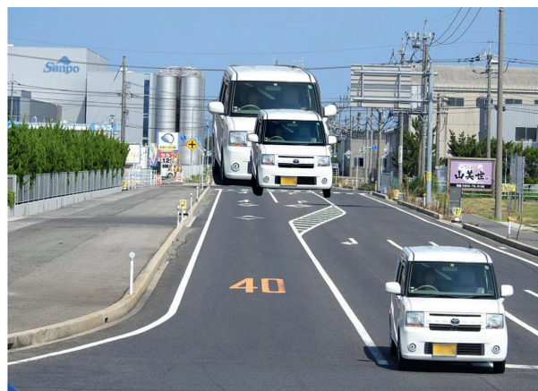
Bild 4: Hier werden wahrscheinlich die meisten Leser zustimmen, dass nun das kleine hintere Auto ungefähr gleich groß wahrgenommen wird wie das vordere.